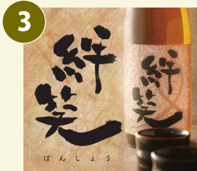
絆笑 ばんしょう 常温 芋焼酎 一升瓶(1.8L) 25度