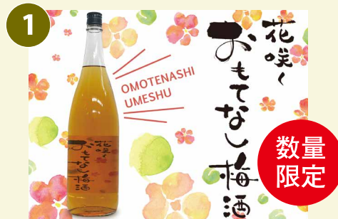
花咲くおもてなし梅酒 常温 梅酒 一升瓶(1.8L) 11%

下記は2019年5月31日までの対象商品となります。お申し込みの状況により、期間中であっても商品が変更になる場合がございますのでご了承ください。 なお、①花咲くおもてなし梅酒を選択の場合は、数量限定(先着順)のため第2希望の商品も選択願います。 商品が終了した際は当社ウェブサイト( https://www.jgroup.jp/ir/incentive/ )にて告知させていただきますので、お申込時にご確認ください。