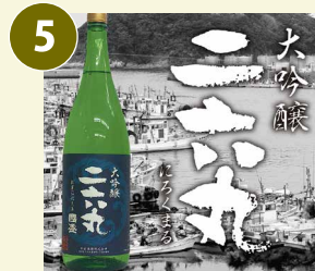
大吟醸 二六丸 常温 にろくまる 日本酒 一升瓶(1.8L) 15度