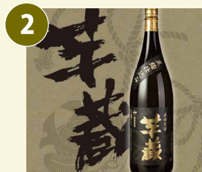
芋蔵 いもぞう 常温 芋焼酎 一升瓶(1.8L) 25度