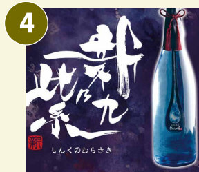
新九乃紫 常温 しんくのむらさき 芋焼酎 一升瓶(1.8L) 20度