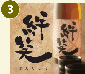
絆笑 ばんしょう 常温 芋焼酎 一升瓶(1.8L) 25度