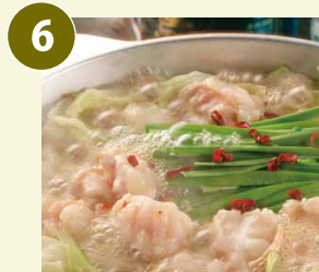
芋蔵の牛もつ鍋 冷凍 〈味噌/2~3人前〉 国産牛もつ250g・ちゃんぽん麺 2袋・スープ800ml・薬味 ※野菜はセットに含まれません