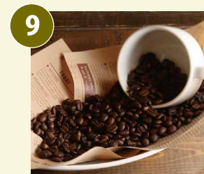
猿Cafeブレンド 常温 一杯抽出型ドリップコーヒー 40杯分