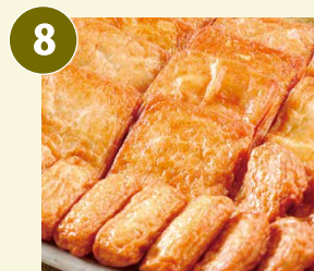
本場 さつまあげ セット 冷凍 にんじん、さつまいも、上揚、野菜 各4個/棒天8個/タコ生姜、明太マヨ天 各2個/ごぼう天8個