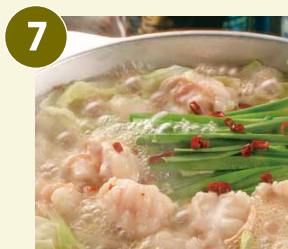
芋蔵の牛もつ鍋 冷凍 〈醤油/2~3人前〉 国産牛もつ250g・ちゃんぽん麺 2袋・スープ800ml・薬味 ※野菜はセットに含まれません