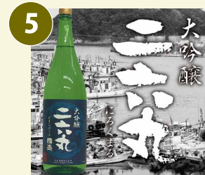
大吟醸 二六丸 常温 にろくまる 日本酒 一升瓶(1.8L) 15度